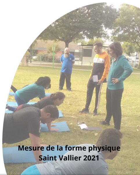
Mesure de la forme physique Saint Vallier 2021