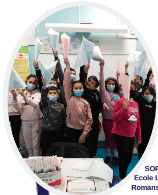
SOP 2022 Ecole Langevin Romans sur Isère