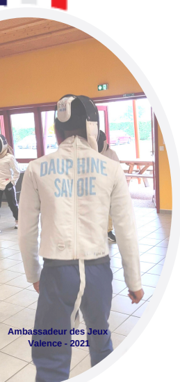
Ambassadeur des Jeux Valence - 2021