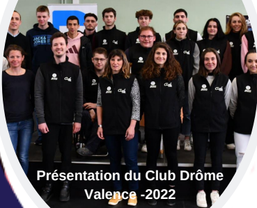
Présentation du Club Drôme Valencia -2022