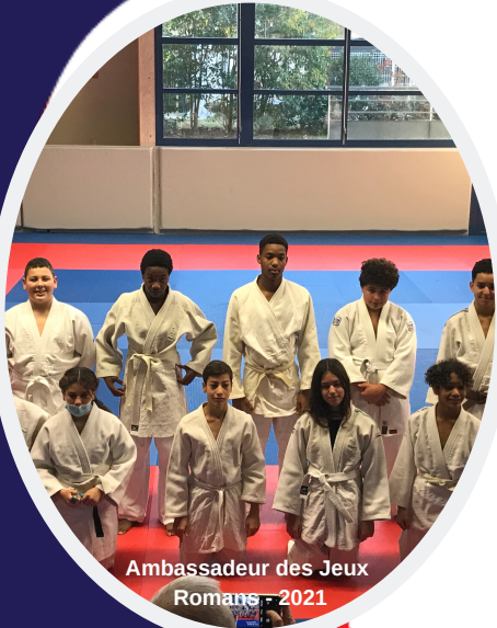
Ambassadeur des Jeux Romans - 2021