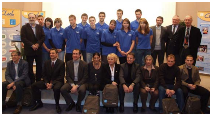
Présentation Club Drôme 2010